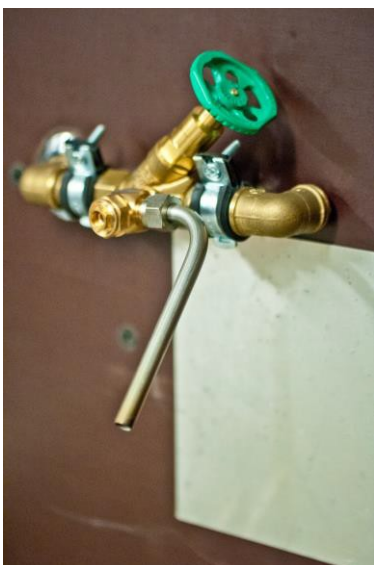
Probenahmeventil; das Auslaufrohr kann abgeflammt werden, damit die Probe nicht verunreinigt